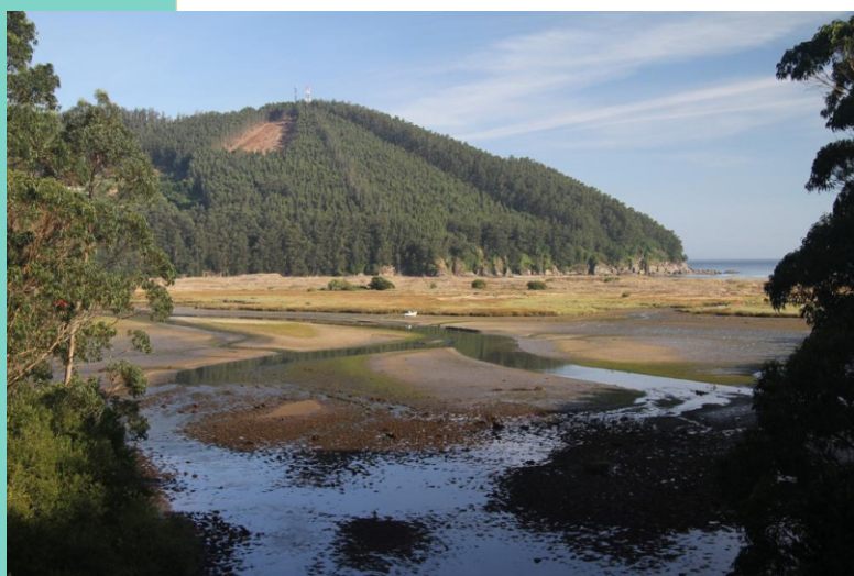
Río das Forcadas