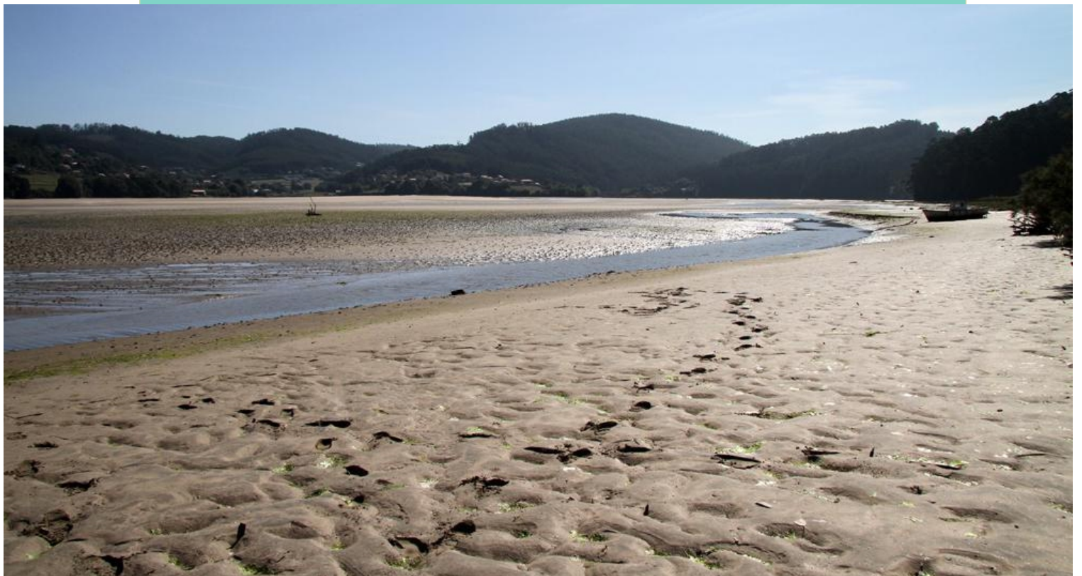
Rio das Mestas