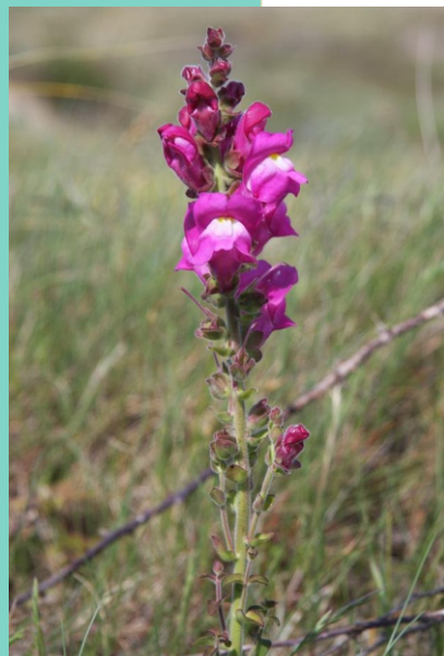
Antirrhinum majus subsp. gallaecica unha planta que so se atopa nesta zona