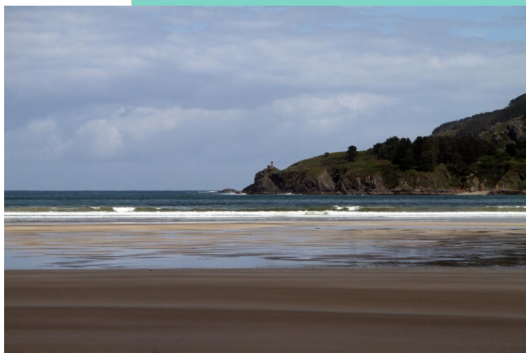
Praia de Vilarrube e Punta Sarridal