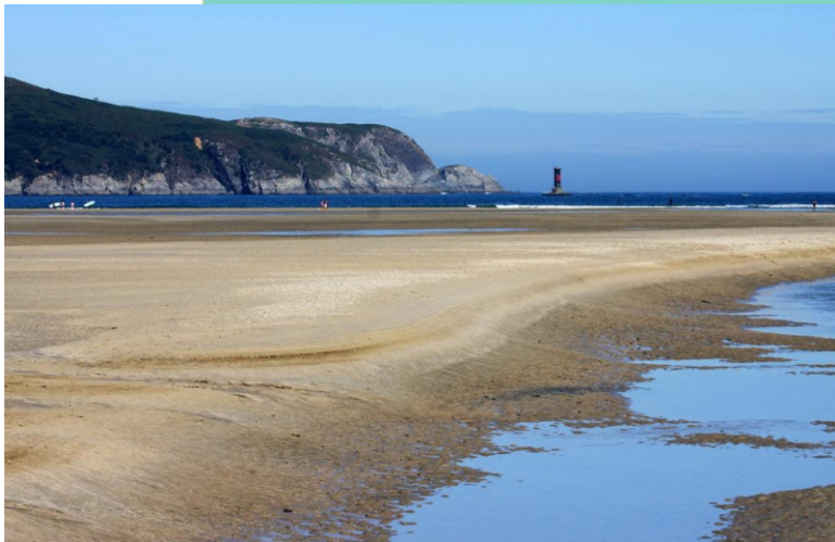
Praia de Vilarrube e Punta Chirlateira