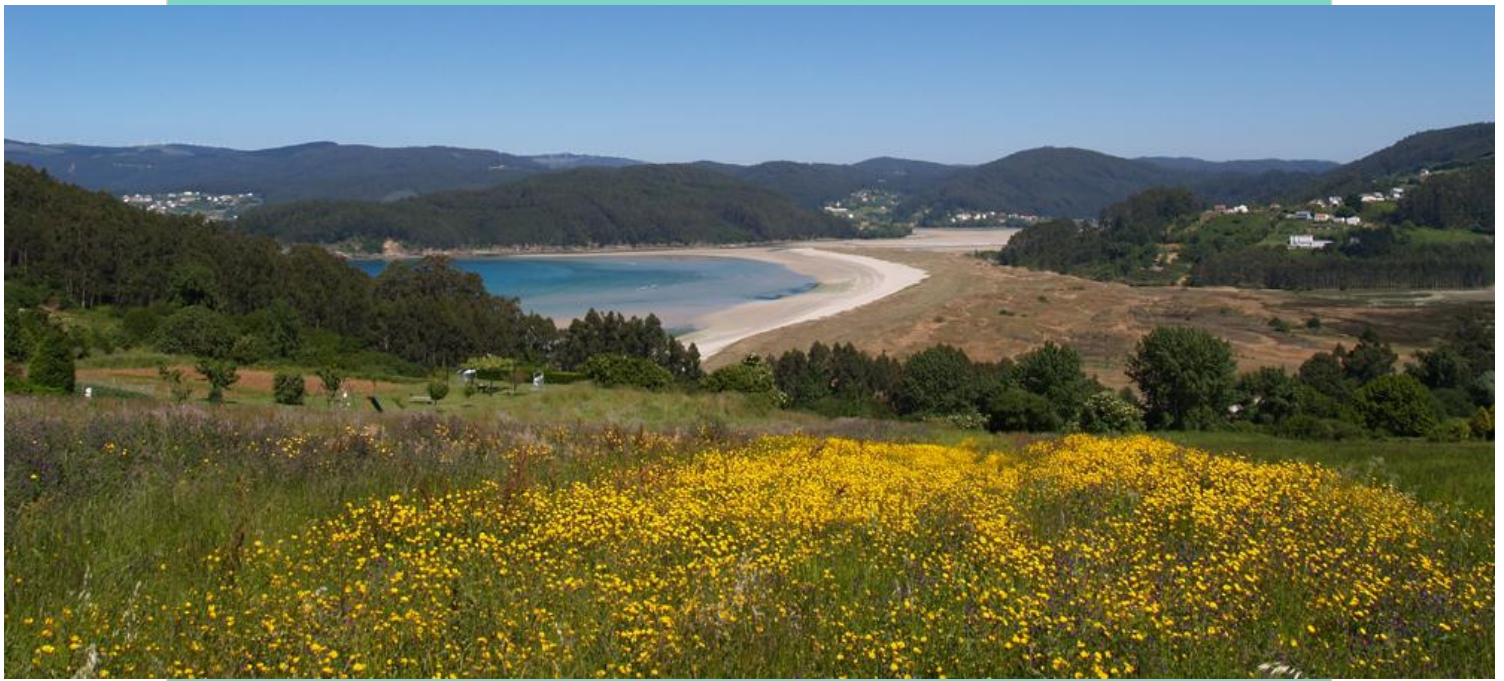
Praia/enseada de Vilarrube