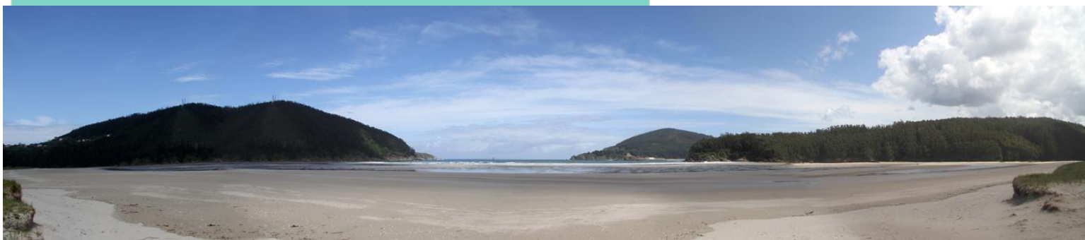
Praia de Vilarrube