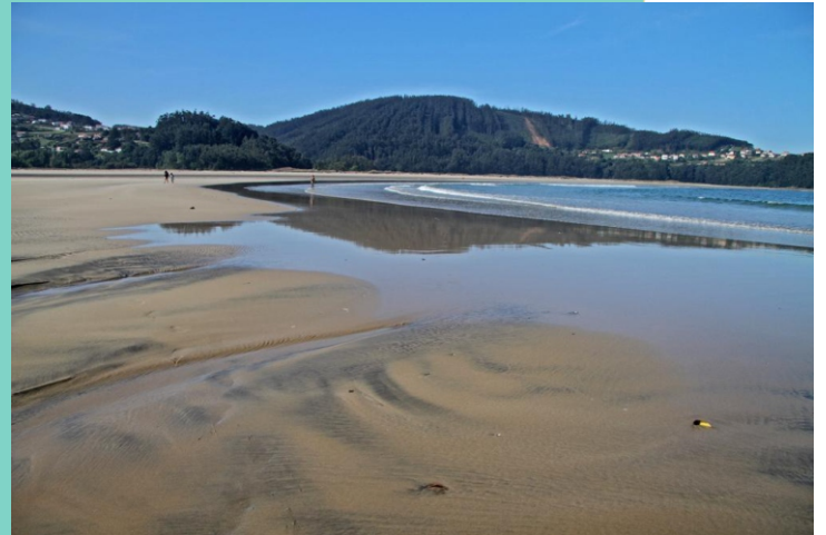
Praia de Vilarrube